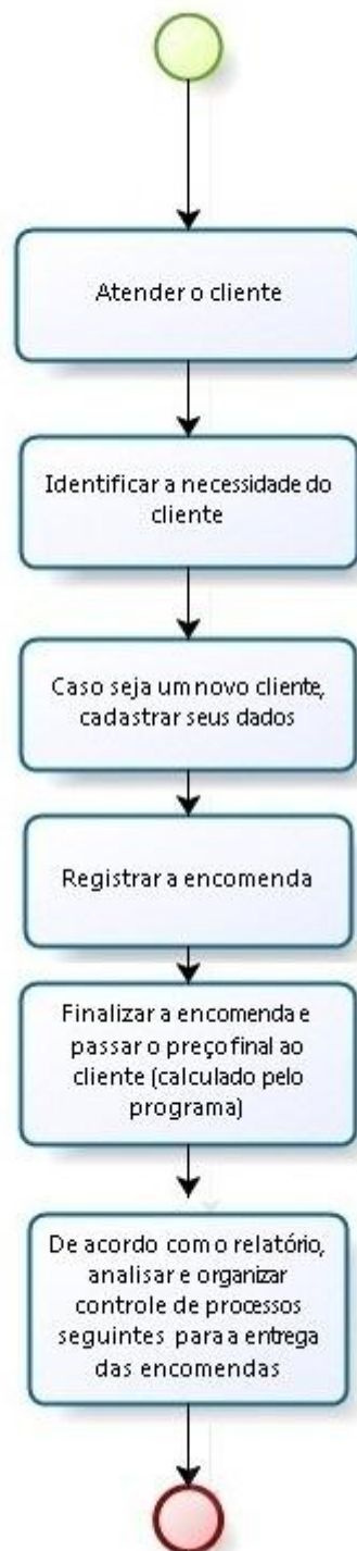
Figura 1 -Mapeamento dos processos de encomenda