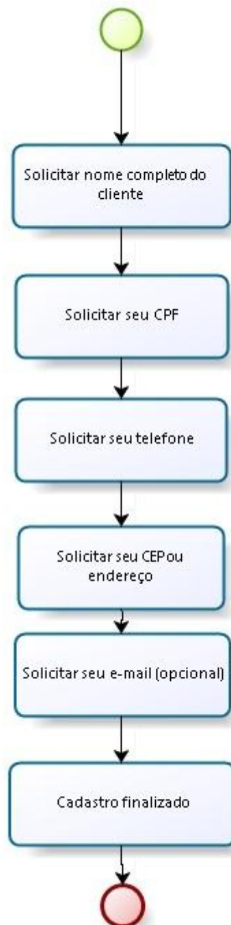
Figura 2 - Mapeamento do cadastro de clientes