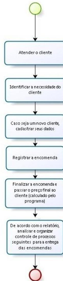
Figura 8 - Comparação dos processos de encomenda