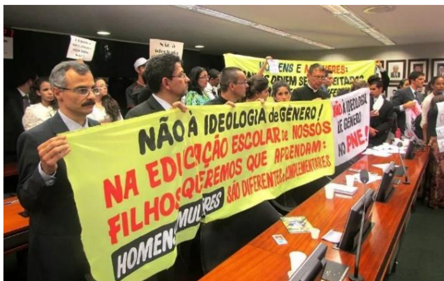
Figura 7 – Deputados a favor do Escola sem Partido