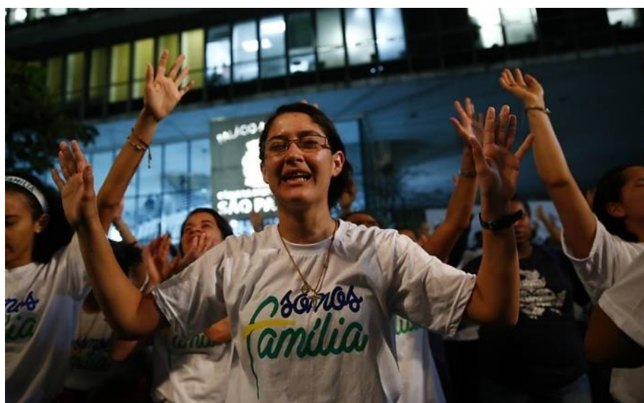
Figura 8 – Manifestação durante votação do PNE