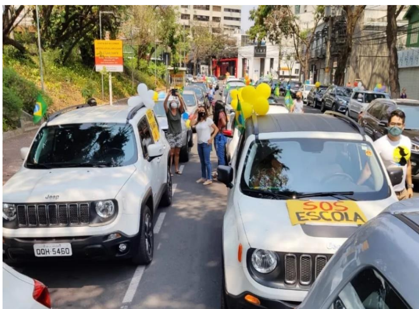
Figura 2 – Carreata