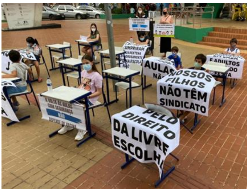
Figura 1 – Movimento a favor da volta às aulas

com segurança NÃO depende da vacina”, entre outros, como as imagens a seguir exemplificam: