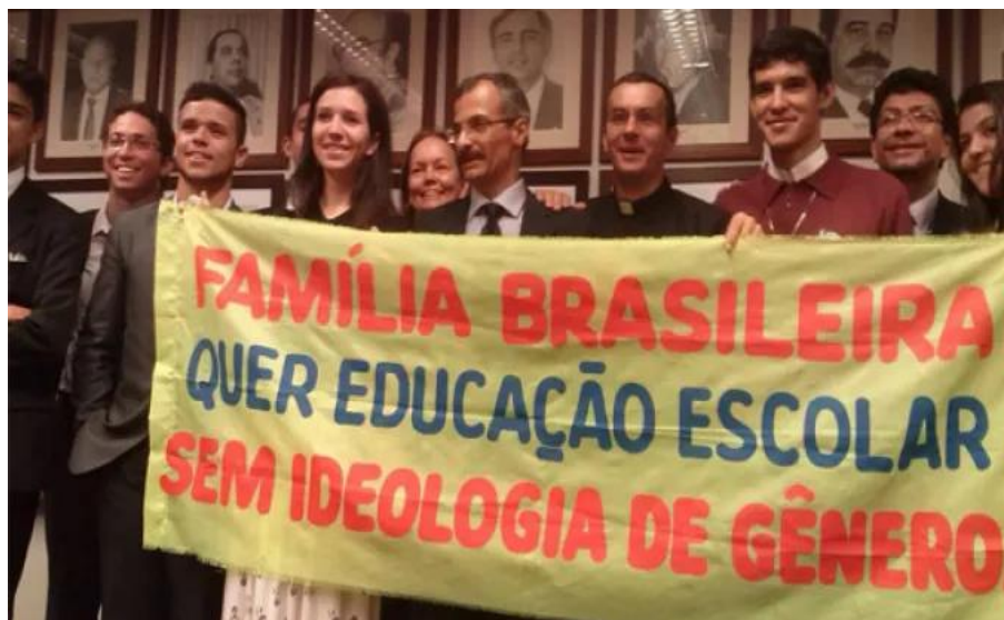
Figura 9 – Manifestação contra ideologia de gênero