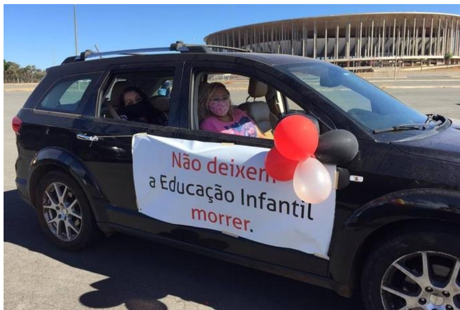
Figura 3 – Não deixem a Ed. Infantil morrer