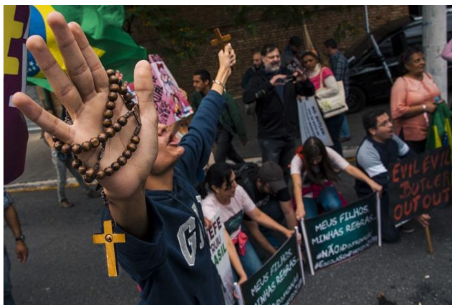
Figura 6 – Manifestação contra a filósofa Judith Butler 156