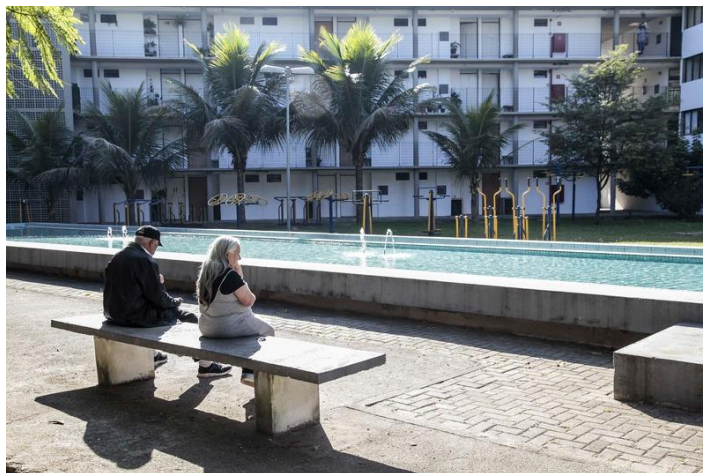
Figura 4: Vila dos Idosos, São Paulo; Fonte: Prefeitura de São Paulo – SP.

concluído em agosto de 2007, o empreendimento disponibiliza moradias projetadas e adaptadas às necessidades próprias da população idosa (D'ottaviano, 2014, p. 261).