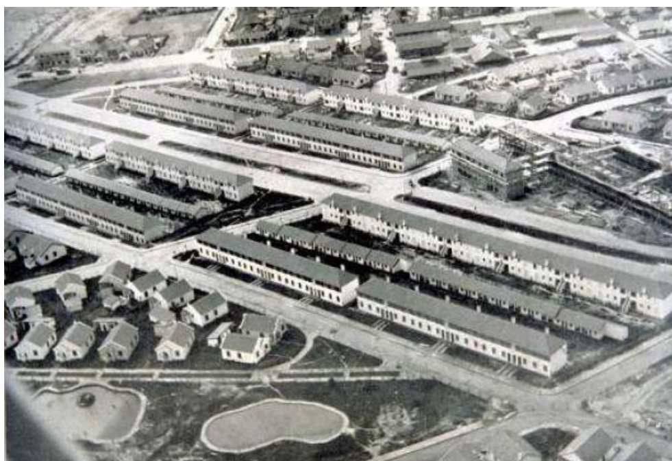
Figura 2: IAPI do Passo d’Areia na década de 1940.

Essa contradição revelava uma tensão entre retórica e realidade: enquanto Vargas declarava, em 1951, que a casa própria era “essencial”, os IAPs alugavam mais de 80% de suas unidades, com destaque ao IAPI do Passo d’Areia em Porto Alegre (Imagem A), o maior do país à época (Bonduki, 2004, p. 106). A política habitacional durante o Estado Novo apresentou, portanto, uma contradição: enquanto o discurso oficial e setores influentes defendiam a casa própria como meio de reduzir custos trabalhistas e promover conservadorismo (transformando trabalhadores em “proprietários”), a prática predominante foi o aluguel pelo eixo social dos IAPs.