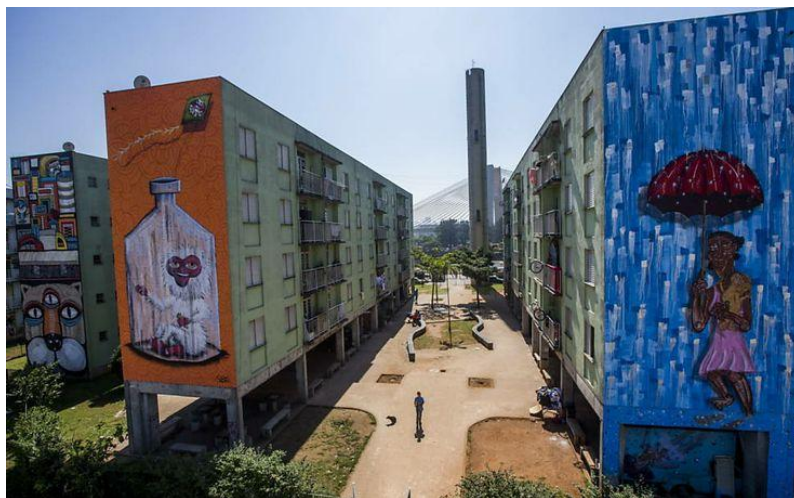
Figura 3: Residencial Parque do Gato

O empreendimento resultou na construção de 594 unidades distribuídas em 18 edifícios laminares, implantados perpendicularmente às marginais, além de equipamentos comunitários como creche, quadras esportivas e playground, conforme se verifica na imagem B: